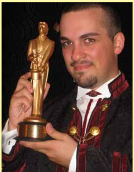
Merlin Ödülü'ne 2011 yılında layık görülerek "Dünyanın En İyi Sihirbazı" seçilmiş